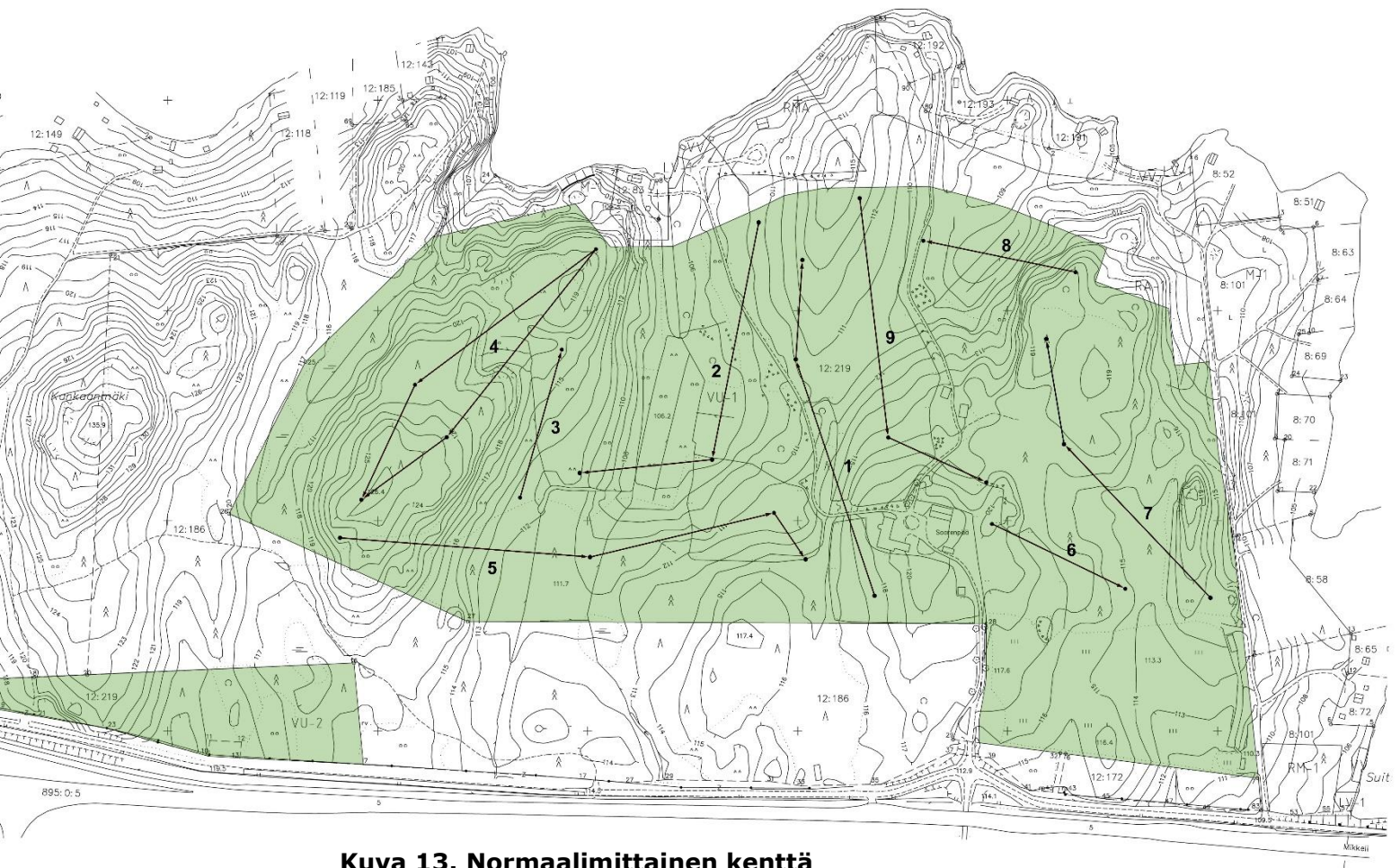
Kuva 13. Normaalimittainen kenttä

Erillisalue alueen lounaisosassa varustetaan VU-2 merkinnällä golfkentän huoltorakennuksia varten.