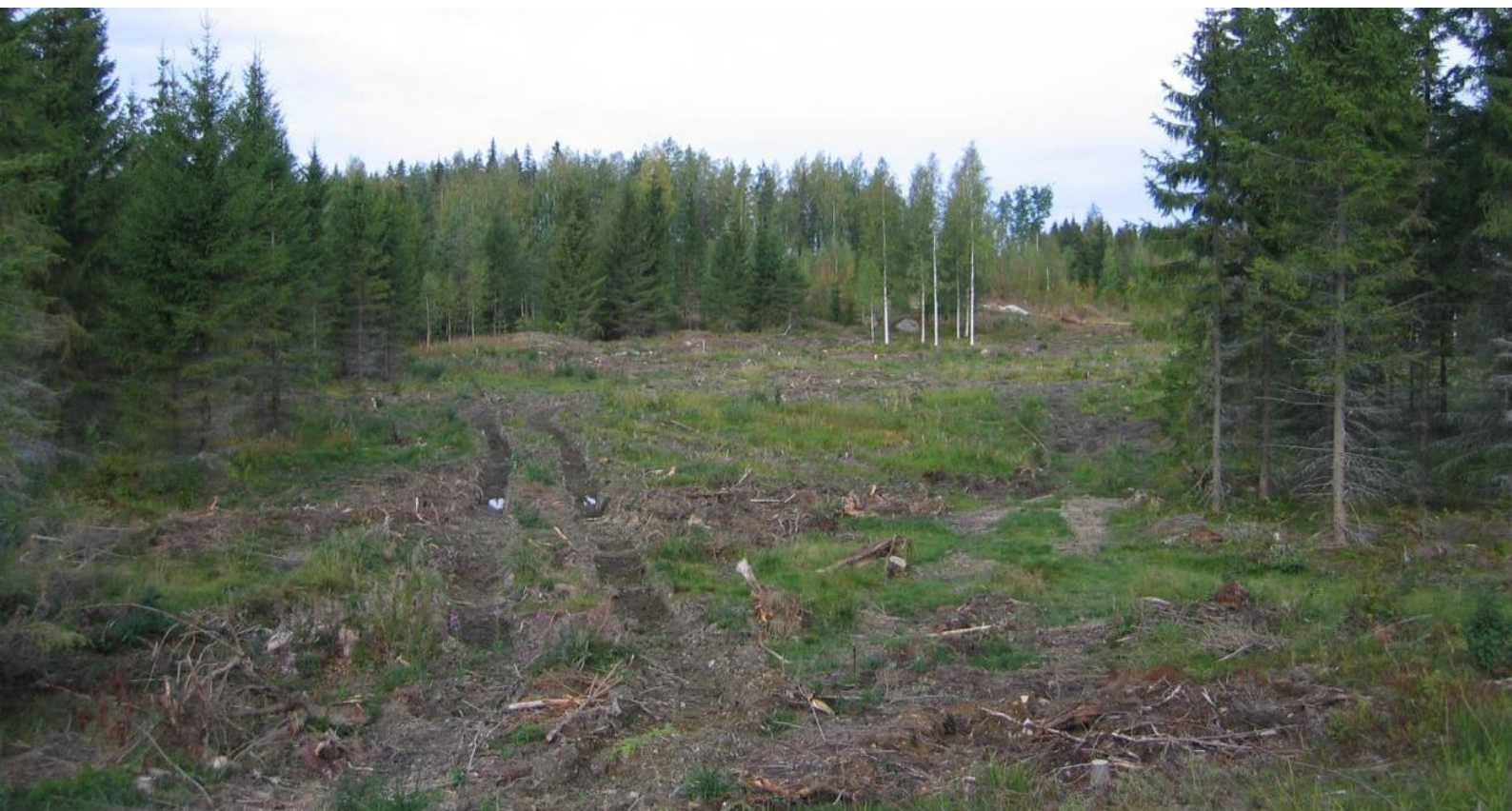
Kuva 2. Puiden poistaminen