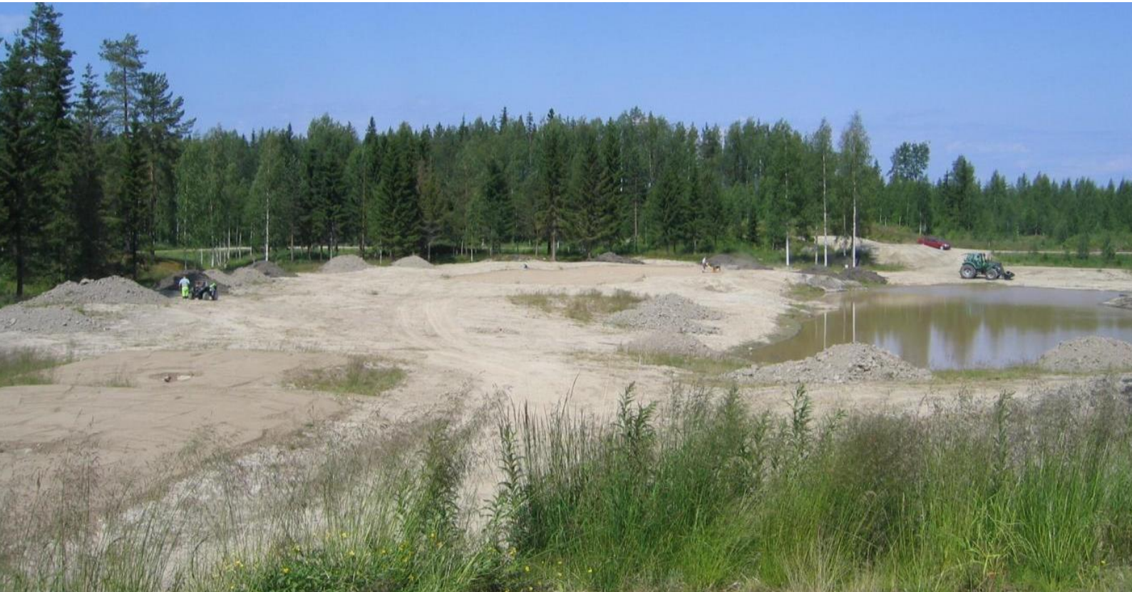
Kuva 5. Maaston perusmuotoilu

Perusmuotoilu tehdään jo tässä vaiheessa mahdollisimman lähelle lopullista muotoa. Viheriön pinta on yleensä aaltoileva ja sen kaltevuus vaihtelee 1.5 ja 15 prosentin välillä. Työ viimeistellään tiivistämällä maamassat, jotta painumia ei pääse syntymään myöhemmin.