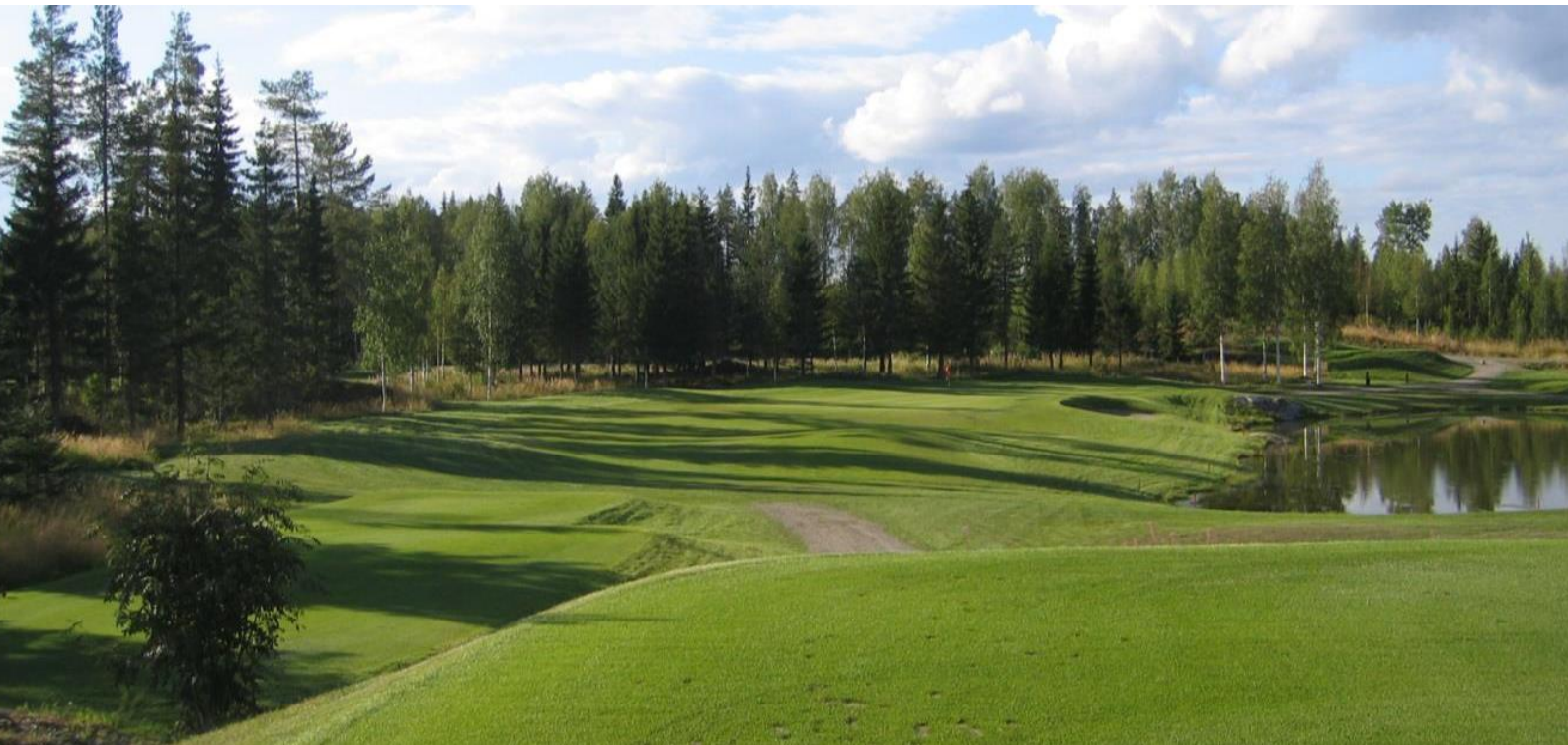
Kuva 7. Valmis peliväylä

Nurmipinnat toteutetaan yleensä kylvämällä. Tarvittaessa voidaan käyttää siirtonurmetusta tai ruiskukylvöä eroosioherkillä jyrkillä rinneillä. Ruiskukylvömenetelmässä siemen ruiskutetaan kiinneaineen seassa maahan. Näin siemen kiinnittyy hyvin ja kiinneaine pitää siemenen varmemmin tasaisesti kosteana parantaen itävyyttä ja estäen eroosiovalumia.