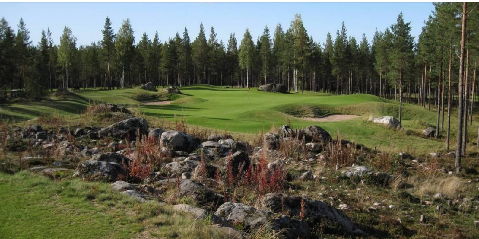
Kuva 8. Par 3 -väylä Oulun Sankivaaran kentällä on toteutettu kivirakkamäen laelle suurten lohkareiden keskelle