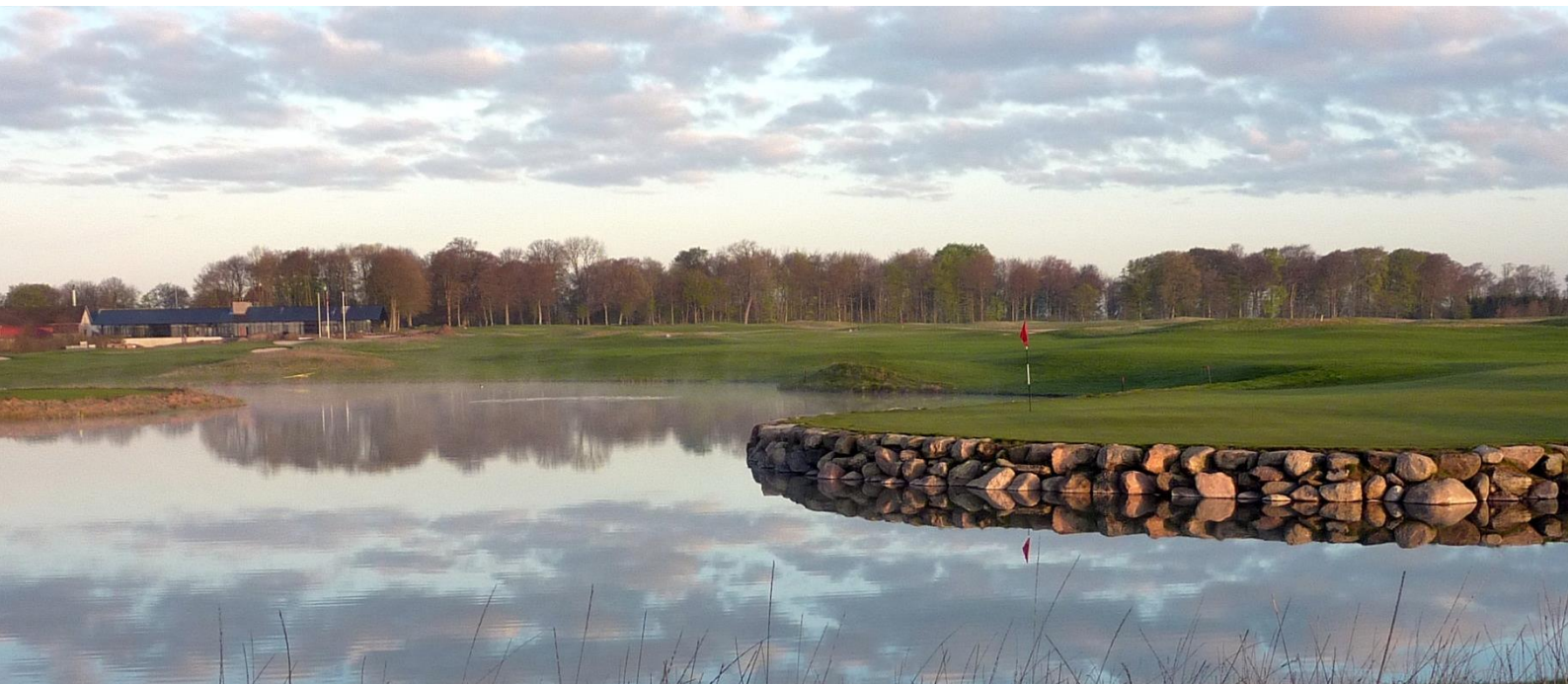
Kuva 10. Golfkentän teko-lampi

Edellä mainitut golfkentän sisälle rakennettavat tekolammet ja muut kosteikkorakenteet ovat mitä parhaimpia rakenteita sade- ja huleveden imeytymisen, viiveen ja puhdistumisen varmistamiseksi.