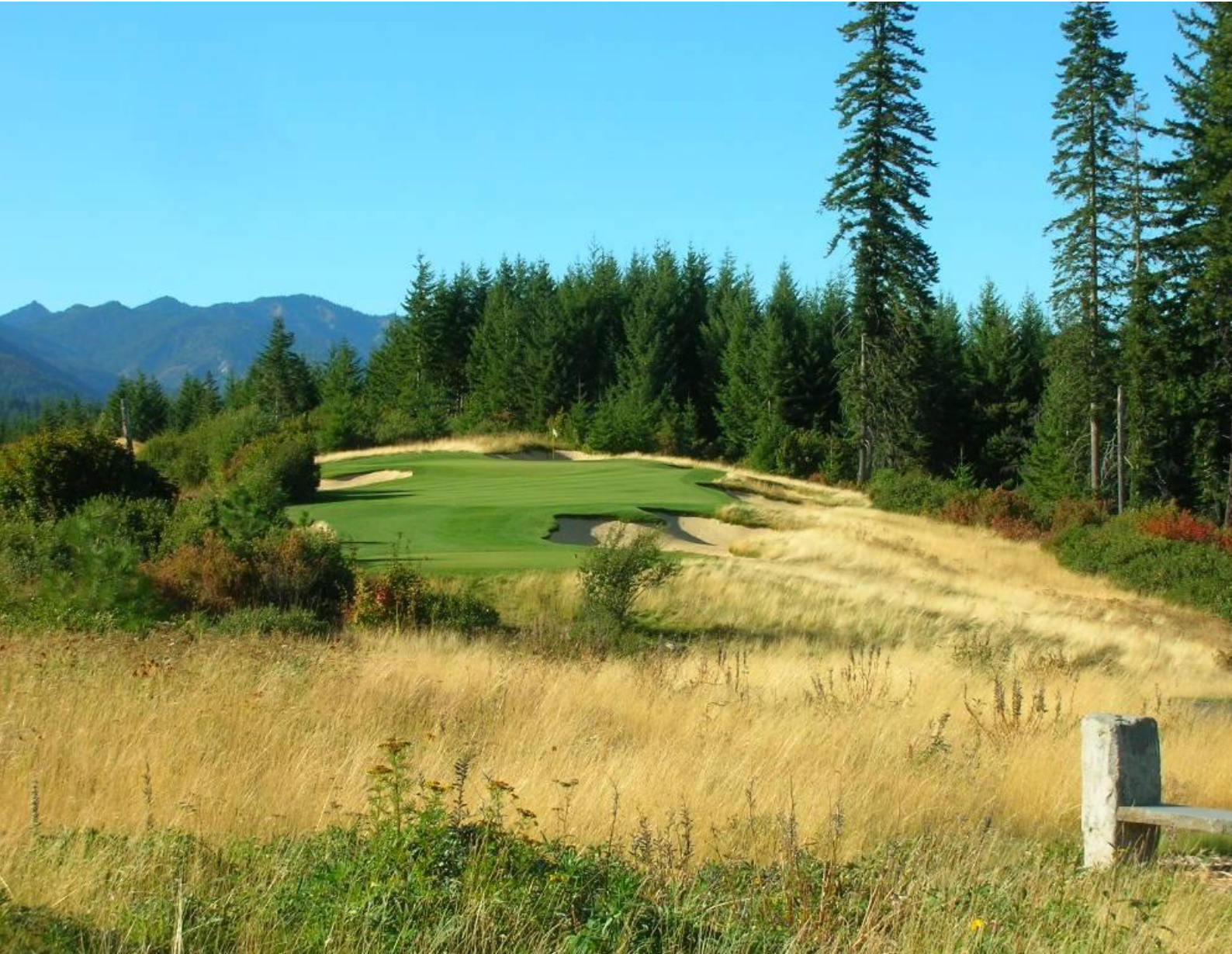
Kuva 9. Niittymäistä karheikkoheinää peliväylän reunalla

Golfkentästä ei rakenneta yhtenäisen vihreää ja tasalaatuista aluetta. Viheriöt ja peliväylät ovat lyhyeksi leikattua aluetta, mutta niiden väliin ja kentän reunoille jäävät ns. karheikkoalueet ovat vaihtelevan korkuista heinää ja metsää. Esimerkiksi leikkaamattoman punanadan avulla saadaan tehtyä luonnonmukaisia niittyalueita, jotka monimuotoistavat maisemaa ja luontoa. Nata myös vaihtaa väriään eri vuodenaikoina mikä elävöittää maisemaa.