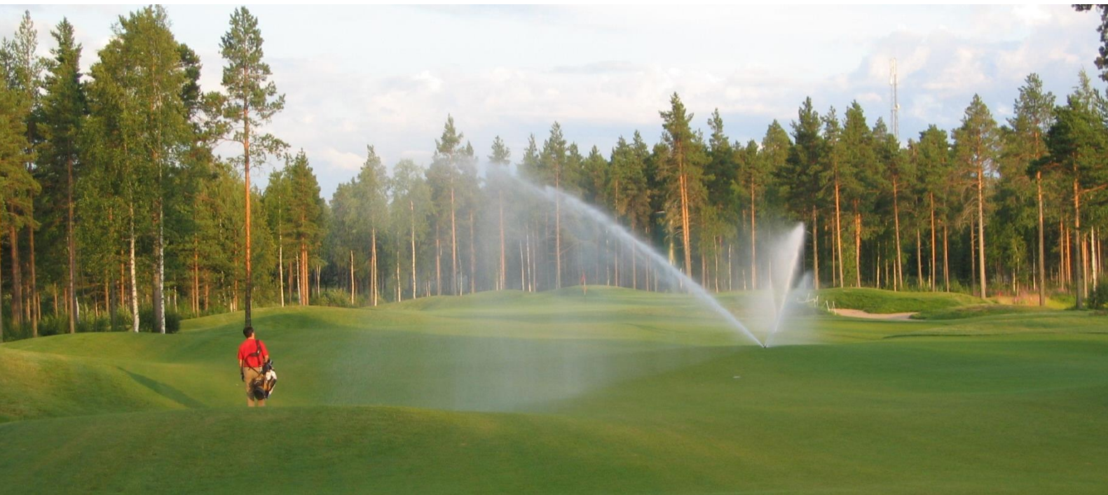
Kuva 6. Peliväylän kastelua

Golfkentän aktiivihoidossa olevat alueet tarvitsevat kastelulaitteiston pysyäkseen kunnossa. Sen vuoksi aloituslyöntipaikoille, peliväylille ja viheriöille rakennetaan kastelujärjestelmä. Pumppuasema asennetaan suurimman tekolammen rantaan, joten kasteluvesi otetaan ensisijaisesti tästä lammeista. Tarvittaessa lampea täytetään Peruedestä saatavalla vedellä.