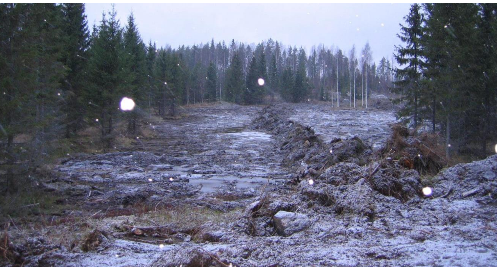
Kuva 3. Pintamaiden kuorinta