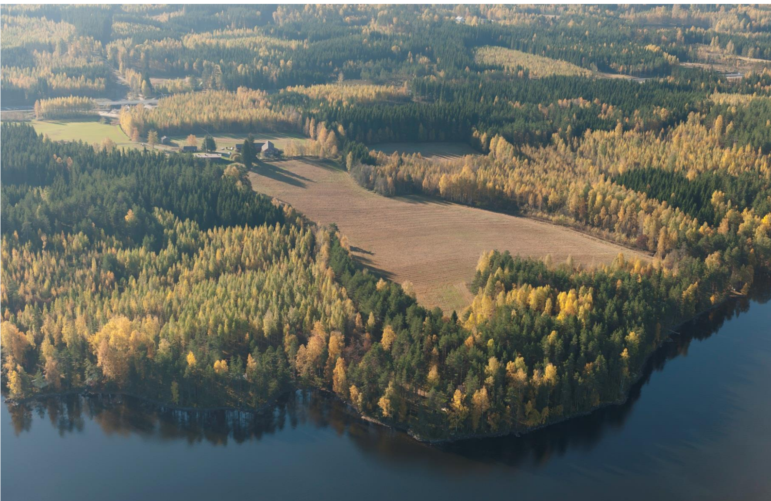
Kuva 11. Peltoalueet ja ympäröivää metsää

Suunnittelualueella tehdyn luontoselvityksen perusteella alueella ei ole suojeltavaksi määriteltyjä eläimiä tai kasveja.