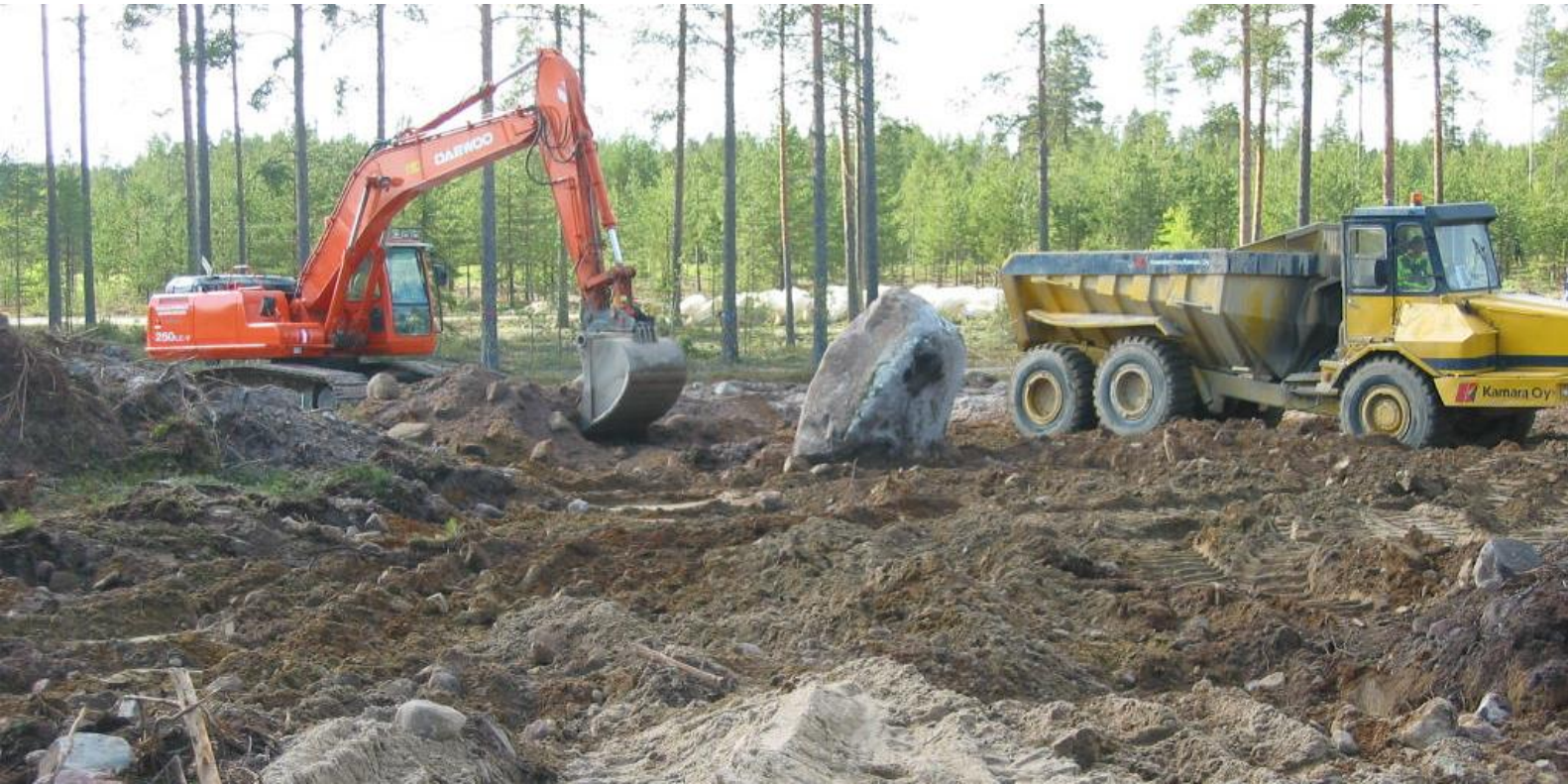
Kuva 4. Maansiirtoa dumpperilla

Kastelujärjestelmää varten tarvittavat lammet ovat yleensä kentän suurimpia kaivantoja. Niistä kaivettavat maamassat käytetään peliväylien pohjamassoina lampien viereisillä peliväylillä, jolloin massoja ei tarvitse kuljettaa pitkiä matkoja.